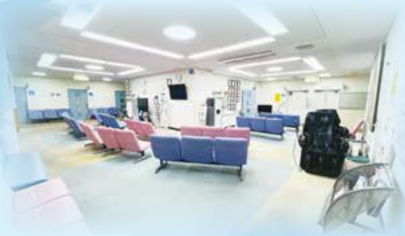
B棟2階 予防医療センター